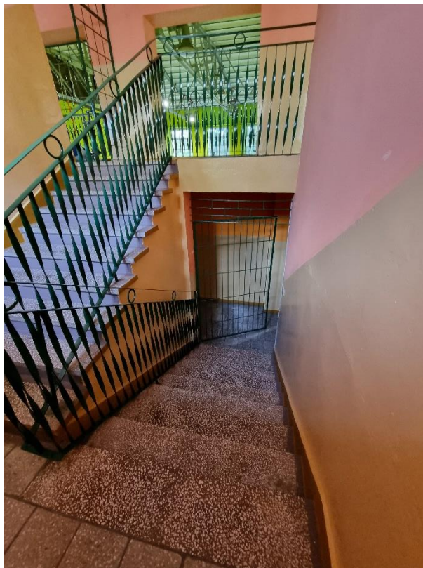
Zdj.10. Widok poglądowy balustrady i kraty drzwiowej.