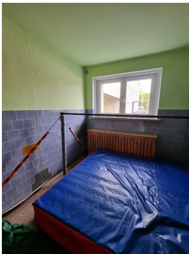
Zdj.8. Widok poglądowy drewnianej osłony grzejnika.