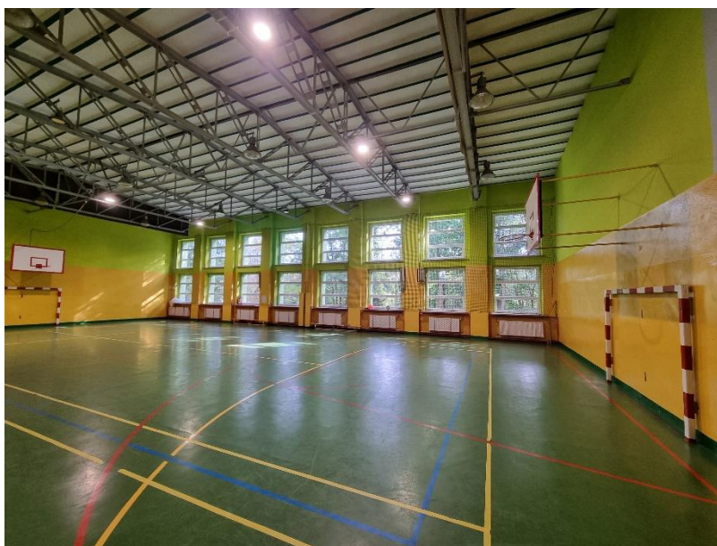
Zdj.7. Widok poglądowy stalowych wiązarów dachowych.