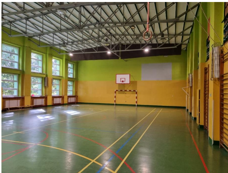
Zdj.2. Widok poglądowy sali gimnastycznej.

Na sali gimnastycznej po wykonaniu nowej podłogi należy wykonać linie boisk analogicznych do stanu pierwotnego (zdj.2, zdj.3).