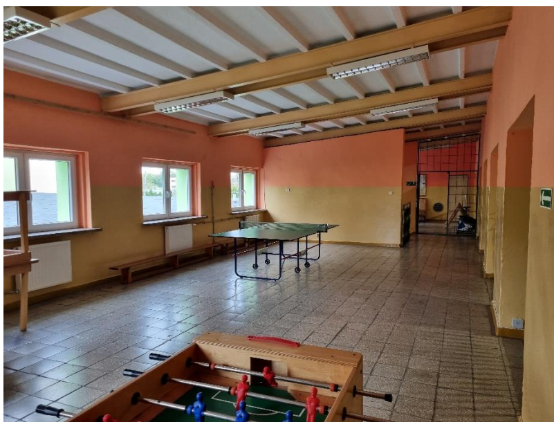
Zdj.9. Widok poglądowy wiązarów dachowych na antresoli.