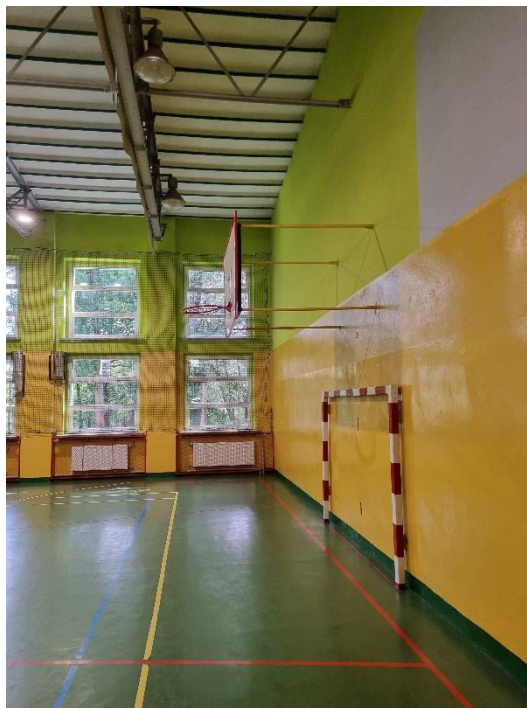
Zdj.5. Widok poglądowy konstrukcji wsporczej kosza do koszykówki.

Należy przewidzieć jedynie renowację metalowej konstrukcji wsporczej dwóch koszów do koszykówki (zdj.5).