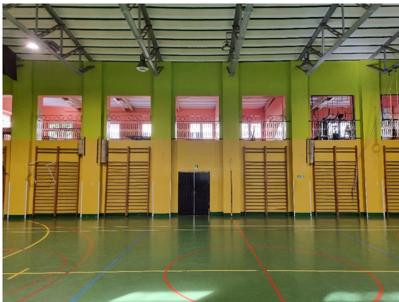
Zdj.4. Widok poglądowy słupów i drabinek.

Na sali gimnastycznej znajdują się jedynie drabinki podwójne (zdj.4) w ilości 7 sztuk. Szerokość jednej podwójnej drabinki wynosi ok. 2,00, natomiast wysokość to ok. 3,00 m. Skrócenie drabinki związane jest z podniesieniem dotychczasowego poziomu posadzki sali o warstwy nowej podłogi, dlatego należy skrócić istniejące drabinki o ok. 10 cm. Możliwe jest odświeżenie istniejących drabinek, dlatego nie ma konieczności zakupu nowych drabinek.