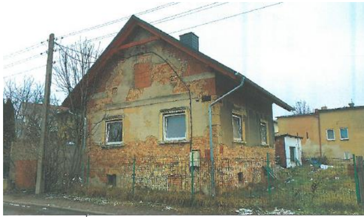
Budynek mieszkalny - elewacja zachodnia