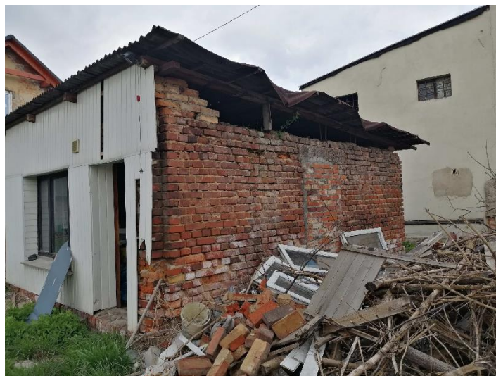
Budynek gospodarczy przeznaczony do rozbiórki - elewacja wschodnia